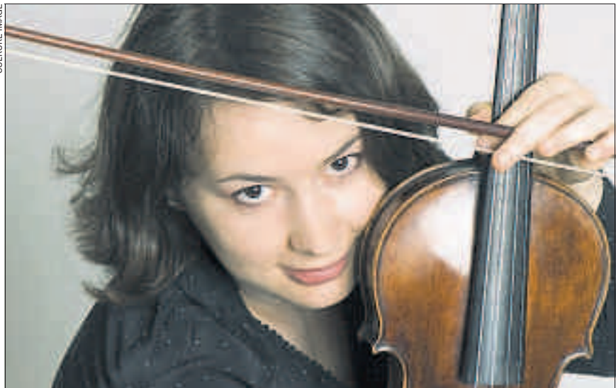
Zwischenfall am Zoll: Patricia Kopatchinskaja, in Bern lebende Violinistin.